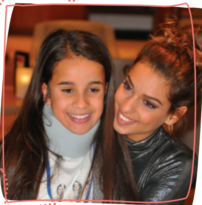
1 er rêve 2015 - Rencontre avec la chanteuse Tal