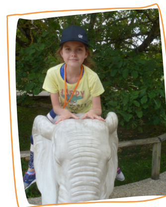
3 e rêve 2019 - découvrir le Zoo de Beauval