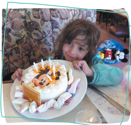
1 er rêve 2015 - Rencontre avec les princesses de Disneyland

POUR UN MÊME ENFANT, PLUSIEURS RÊVES RÉALISÉS