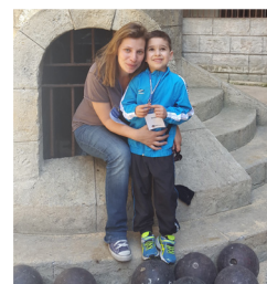
MÉLANIE (39 ans) bénévole depuis 6 ans

Une petite fille m'a même fait cette déclaration, après avoir réalisé son rêve : « C'était le plus beau jour de ma vie. » ! En fait, tout ce qu'un bénévole reçoit est incomparable à côté du peu qu'il donne. Quoi de plus beau que de faire rêver des enfants qui ont une vie parsemée de cauchemars ? Quoi de plus beau qu'un enfant ? »