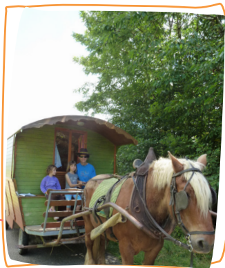
1 er rêve 2015 - dormir dans une roulotte