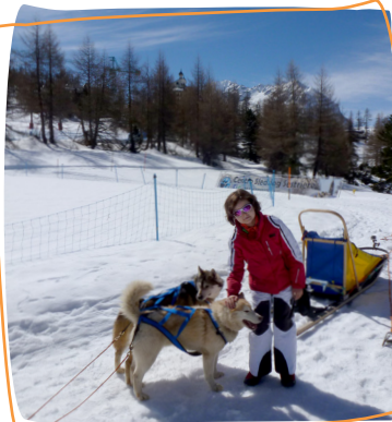
2 e rêve 2017 - guider des chiens de traîneaux