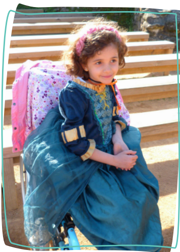
2 e rêve 2018 - Découverte du Puy du Fou