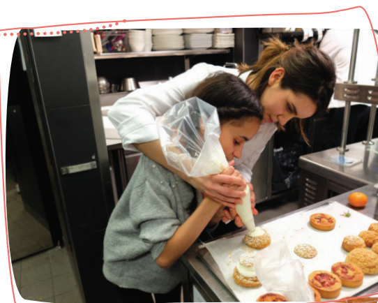
2 e rêve 2019 - Atelier de pâtisserie