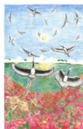
Arthur Grandchamp des Raux