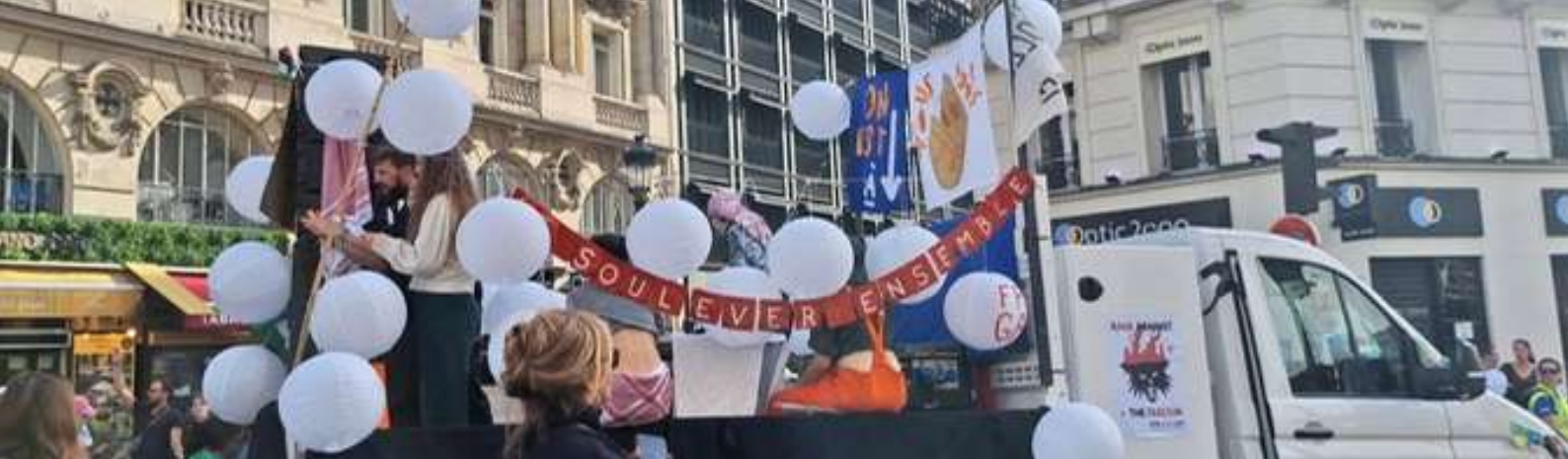
Marche Climat 2025